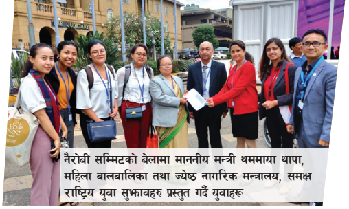
नैरोबी सम्मिटको बेलासा माननीय मन्त्री थममाया थापा, महिला बालबालिका तथा ज्येष्ठ नागरिक मन्त्रालय, समक्ष राष्ट्रिय युवा सुभाबहरु प्रस्तुत गर्दै युवाहरु

आइसीपीएडि २५ नैरोबी सम्मेलनमा नेपाल सरकारले आफ्नो प्रतिबद्धता प्रस्तुत गर्ने क्रममा माननीय महिला, बालबालिका तथा ज्येष्ठ नागरिक मंत्री थम माया थापाले युवाहरुको स्वास्थ्य र कल्याणमा लगानी गरेर उनीहरुले बृहत् यौनिकता शिक्षाको माध्यमले आफ्नो प्रजनन् अधिकार सुनिश्चित गर्ने प्रतिबद्धता गर्नु भएको थियो, जुन कुरालाई आरएचआरएनले प्रकाशन गरेको राष्ट्रिय युवा सुभावमा खुलाएको थियो।