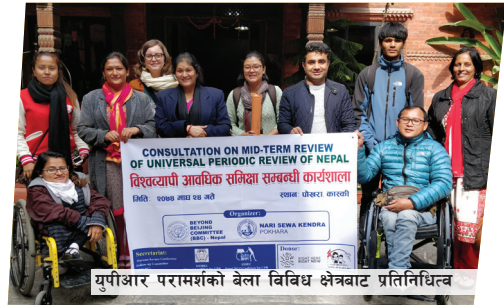
युपीआर परामर्शको बेला विविध क्षेत्रबाट प्रतिनिधित्व

अर्थपूर्ण र समावेशी युवा सहभागिता RHRN को एक मूल मान्यता हो जबकि वयस्क-युवा साभेदारी मुख्य दृष्टिकोण। आरएचआरएन वकालतमा MIYP को एउटा शोकेस हो, जहाँ प्रत्येक संस्थाको कम्तिमा एक सदस्य ३० वर्ष भन्दा कम उमेरको छन्, स्टियरिंग समितिको कम से कम ५१% सदस्यहरु ३० वर्ष भन्दा कम उमेरका छन् र ७ स्टियरिंग समितिको सदस्यहरु मध्ये एक युवा नेतृत्वको संगठनलाई समर्पित छन्। सम्भव भए सम्म अवसरहरु आउँदा युवाहरुलाई पहिलो प्राथमिकताका साथ प्रदान गरिएको थियो, जसको अर्थ युवाहरुको सहभागिता टोकनस्टिक मात्र थिएन। जसले गर्दा थुप्रै युवाहरुले पहिलो पटक राष्ट्रिय वा अन्तर्राष्ट्रिय पैरवी फोरममा बोल्ने मौका पाए। यसबाहेक, होस्ट संस्था (host organization), YUWA एक युवाले नेतृत्व गरेको संस्था