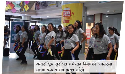
अन्तर्राष्ट्रिय सुरक्षित गर्भपतन दिवसको अवसरमा मलमा फ्यास मब प्रस्तुत गरिदै

कन्फरेन्स (advancing youth SRHR conference) ले पनि युवाको यौन तथा प्रजनन् स्वास्थ्य र अधिकारको लागि समर्थन प्राप्त गर्न सकेको थियो, जहाँ विभिन्न मन्त्रालय, राष्ट्रिय युवा परिषद्, शैक्षिक जनशक्ति विकास केन्द्र, संयुक्त