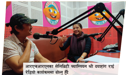
आरएचआरएनका सेलिब्रिटी च्याम्पियन श्री दयाहांग राई रेडियो कार्यक्रममा बोल्नु हुँदै

यस बाहेक, RHRN नेपालले मिस पिंक नेपाल २०१८ मा,