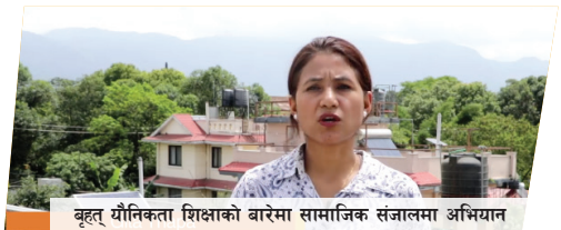
वृहत् यौनिकता शिक्षाको बारेमा सामाजिक संजालमा अभियान

एउटा "निर्णय" नामक ६ एपिसोडको वेब श्रृंखला विकास गरी प्लेटफर्म संगठन र सेलिब्रिटीहरूको सोशल मिडिया पृष्ठहरू मार्फत् प्रसार गरिएको छ। पहिलो एपिसोड लगभग १५,००० दर्शकहरूले हेरेका छन्। काठमाडौं पोष्ट जुन राष्ट्रिय दैनिक समाचार पत्र हो त्यसले यो वेब