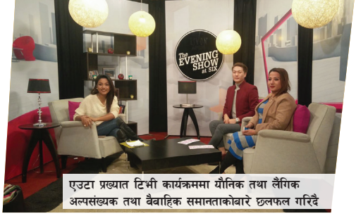
एउटा प्रख्यात टिभी कार्यक्रममा यौनिक तथा लैंगिक अल्पसंख्यक तथा वैवाहिक समानताकोबारे छलफल गरिँदै

यी कार्यशालाहरू पछि, राष्ट्रिय स्तरका मिडियाहरूले विषयगत मुद्दाहरूलाई, सार्वजनिक अपील गर्ने गरी र राष्ट्रिय र स्थानीय समाचारपत्रहरू र समाचार पोर्टलमा तथ्यपूर्ण र प्रगतिशील ढङ्गले कभर गरे। RHRN ले अन्नपूर्ण र सम्पन्न साप्ताहिक अखबार (लोकप्रिय प्रिन्ट मिडिया) जस्ता राष्ट्रिय मिडियासँग सम्झौता गर्न सक्षम भयो जसले हरेक हप्ता LGBTI को मुद्दाहरूमा लेख प्रकाशित गर्दै दुई महिनासम्म नेपालको अधिकांश भागमा वितरण गर्यो। १६ वटा अनलाइन र अफलाइन मीडियाले यौनिक तथा लैङ्गिक अल्पसंख्यक र वैवाहिक समानतामा समाचार कभर गर्यो। २०१९ मा, विभिन्न मिडियामा लेख प्रकाशित गर्न नेपाली पत्रकार फोरमसँग सम्झौता गरियो। यी लेखहरूमा लिङ्गमा आधारित भेदभाव, हिंसा र महामारीको बेलामा LGBTI समुदायको मुद्दाहरूमा जागरूकता सम्बन्धित सामग्री समावेश गरिएको थियो।